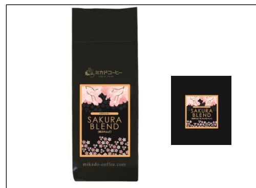
左：「桜ぶれんど」レギュラーコーヒー 右：同 ワンパック・コーヒー（簡易抽出型）

ミカドコーヒー公式 facebook, https://www.facebook.com/MikadoCoffeeSince1948/