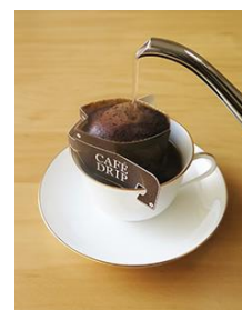
ワンパック・コーヒー （簡易抽出型）