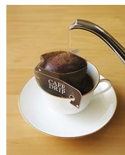
ワンパック・コーヒー （簡易抽出型）